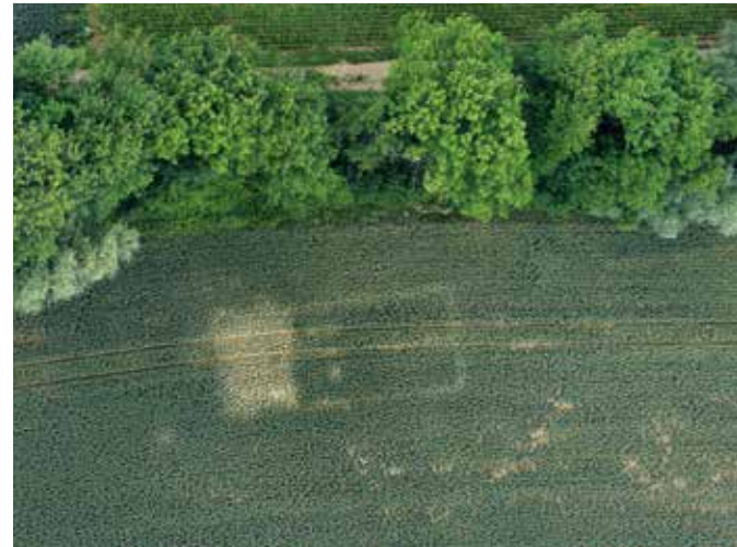
Bad Friedrichshall-Kochendorf: Fundamente einer ehemaligen KZ-Baracke im Luftbild