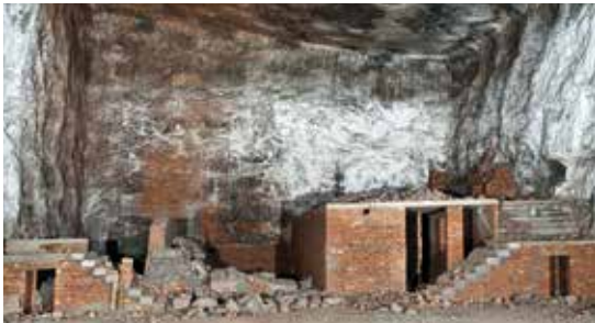
Salzbergwerk Bad Friedrichshall-Kochendorf: Ehemalige Rüstungsfabrik „Eisbär“, Miklos-Klein-Stiftung

E-Mail: nicola.geldmacher@rps.bwl.de Rückfragen unter Telefon: +49 (0)711-90 44 51 02