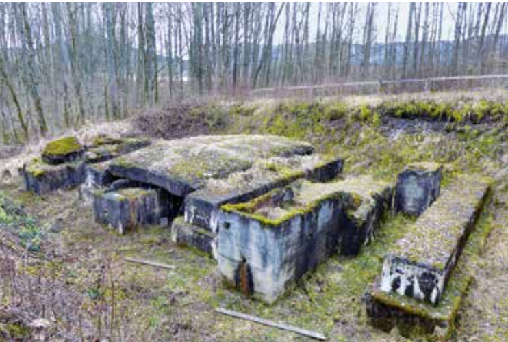
Bisingen: Industrieruinen des Schieferölwerks „Wüste 2“

Dans le Bade-Wurtemberg, certains vestiges des camps annexes de Natzweiler sont d'ores et déjà protégés au titre des Monuments historiques. Dans le cadre d'un projet de recherche de quatre ans qui a été lancé au sein de l'Office régional des monuments historiques du Bade Wurtemberg, ces vestiges font désormais l'objet d'intenses travaux d'études. Parallèlement, des recherches sont également effectuées depuis les airs, au sol et dans les centres d'archives afin d'exhumer d'autres traces de l'oubli. Les fouilles archéologiques qui ont cours s'appuient sur les techniques et méthodes les plus modernes.